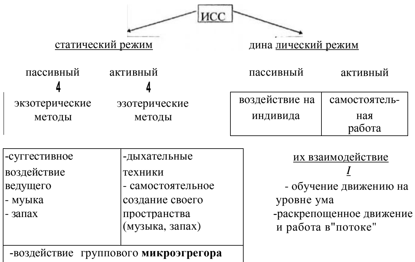
СХЕМА РАБОТЫ В ИСС В СТАТИЧЕСКОМ И ДИНАМИЧЕСКОМ РЕЖИМАХ.

В связи с этим, на первый план выходят вопросы методики погружения. На таблицах 4 и 5 показаны схемы методических приемов и средств биоэнергопластики для контролируемого выхода в ИСС. Предлагаемые таблицы являются результатом экспериментальных практических исследований методики, соединяющей в себе элементы йоги, сакрального и спонтанного танца, являющихся основным содержанием релаксационной биоэнергетической пластики.