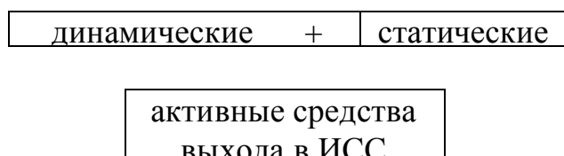
СХЕМА ПРИНЦИПИАЛЬНЫХ ОСОБЕННОСТЕЙ И ПРИЕМОВ РАБОТЫ В ИСС В СТАТИКОДИНАМИЧЕСКОМ РЕЖИМЕ.